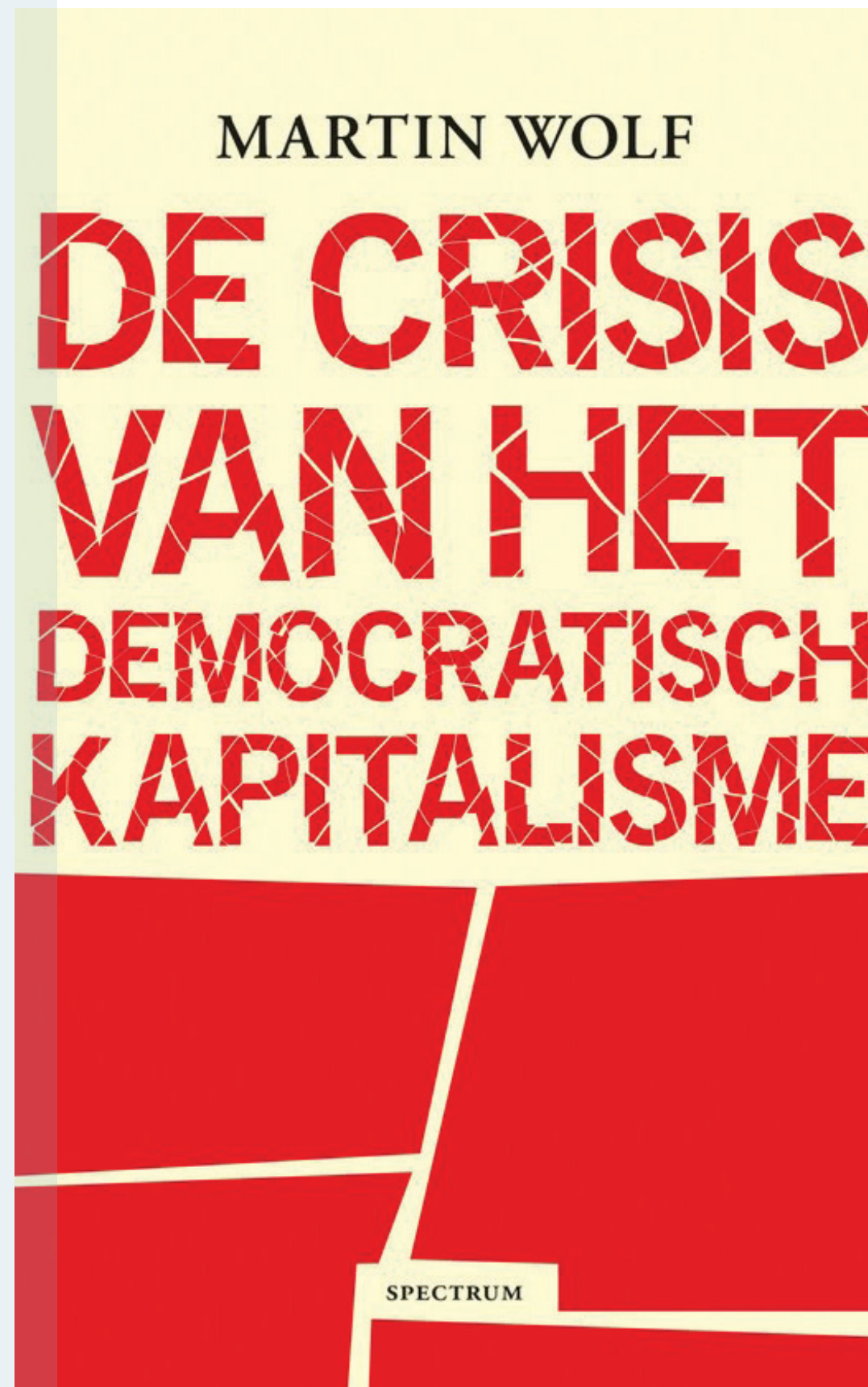
Martin Wolf, De crisis van het democratisch kapitalisme, 2023, ISBN 9789000355495

Je moet goed zoeken om een begin van een omwenteling te bespeuren: het hopelijk standhouden van de Europese Green Deal, de winst van Labour misschien? In Nederland valt er van het huidige kabinet niets te verwachten, en in tal van andere liberale democratieën staan de autocraten voor de poort. De Amerikaanse verkiezingen kunnen in geval van een overwinning voor Trump voor alle liberale democratieën desastreus zijn. Wolfs laatste roep is een belangrijk signaal, maar het gevoel dat aan het eind van het boek omhoog kruipt, is toch een beetje: too little, too late. Maar goed, ook alle kleine beetjes helpen.